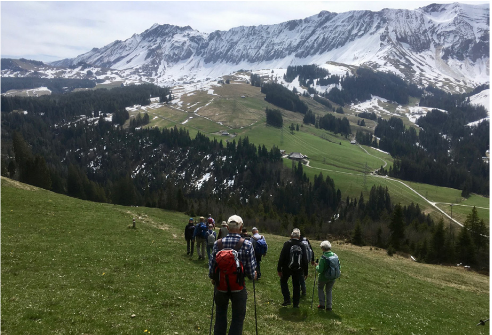
Foto: Veteranen, Wanderung im Entlebuch