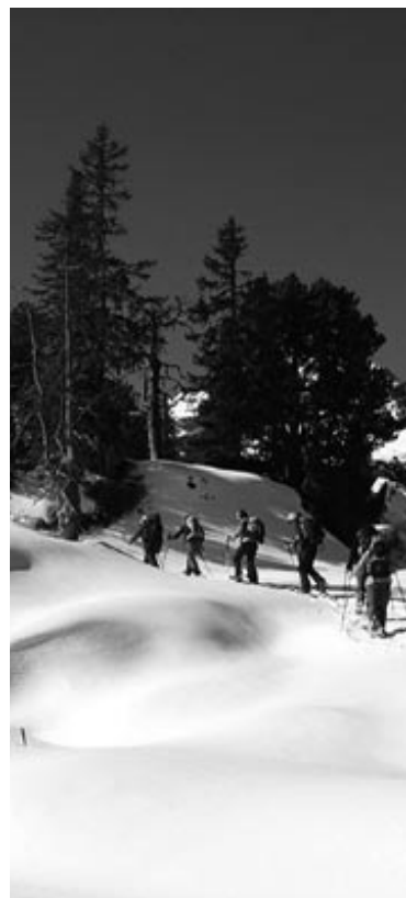
Foto: Aufstieg zum Gemmenalphorn.