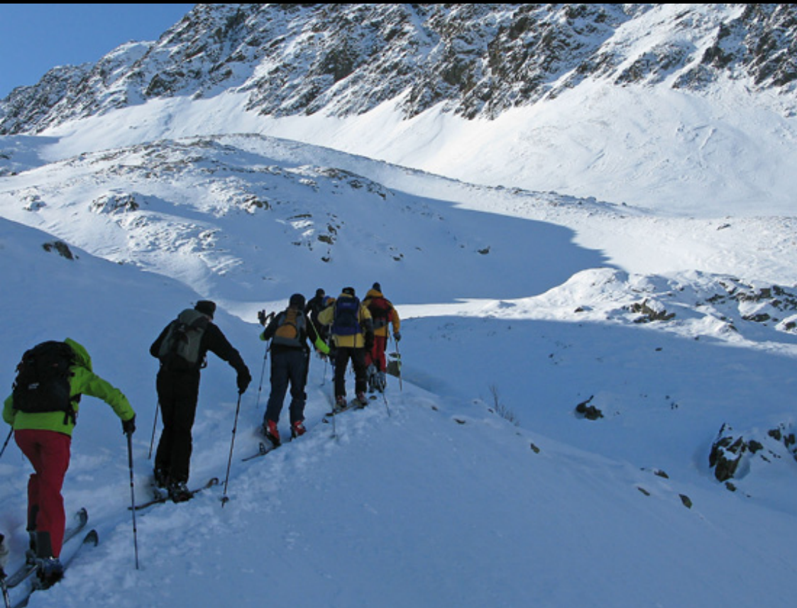
Skitour in St. Veith, Tirol

Ausgabe Januar–März 2013 MB Nr. 1 45. Jahrgang | ZtgNr. 30240