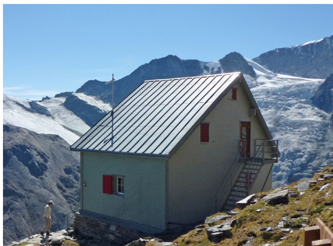
Alte und neue Weisshornhütte im Vergleich.