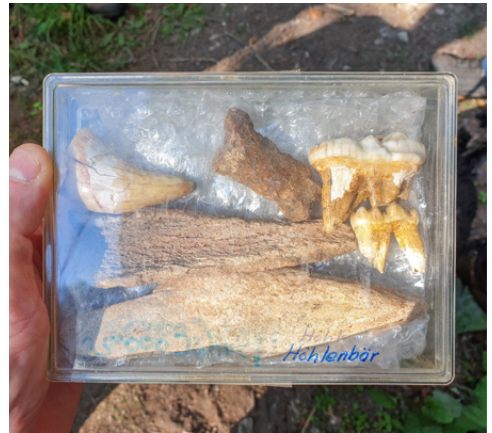
Erklärungen zur Fundstelle