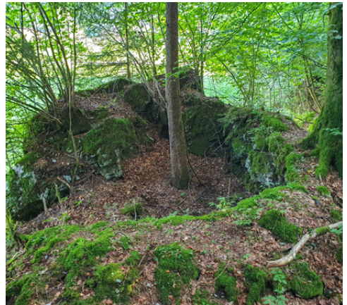
Ein alter Kalkofen