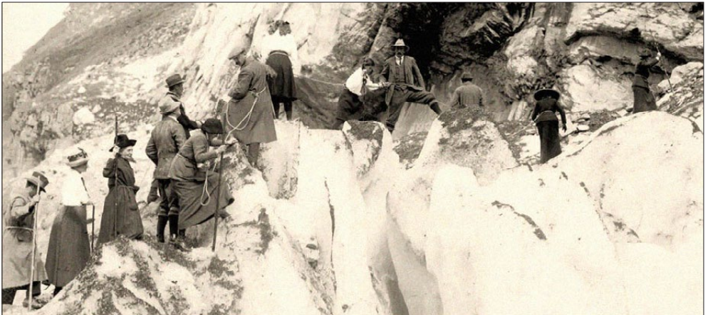
um 1925, Schweiz - Bergwanderung mit Touristen aus verschiedenen Ländern