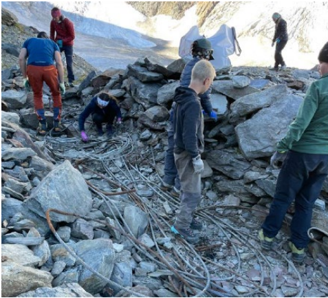
Überlassenschaften, welche im Hochgebirge fast nicht verrotten.