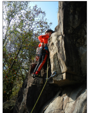
KiBe-Klettern in Ponte Brolla im Tessin