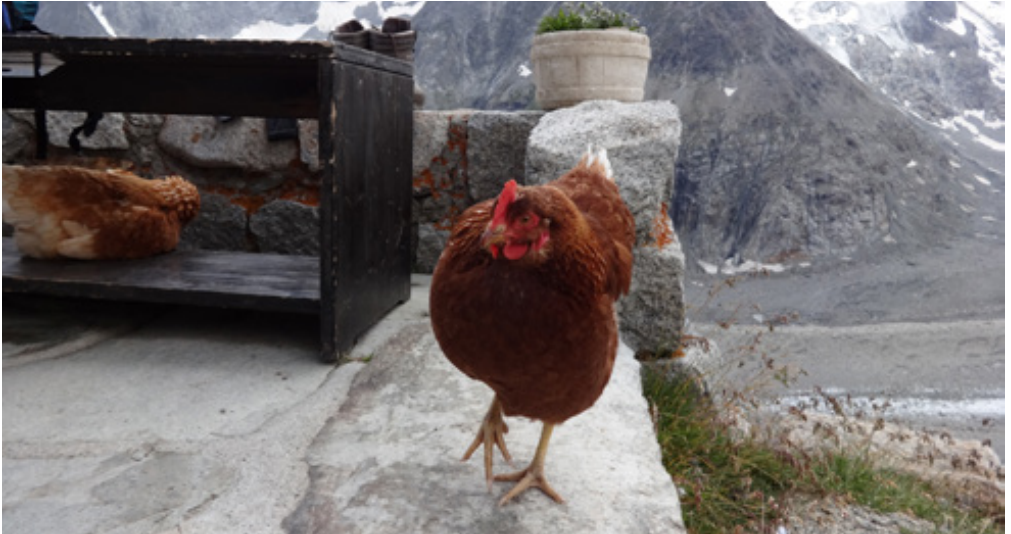
Das gemeine Hüttenhuhn, Oberaletschhütten.