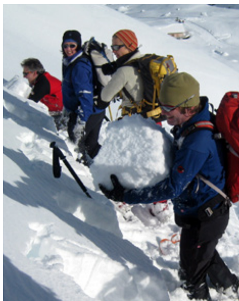
Impression Lawinenkurs 2012 Nr. 1.