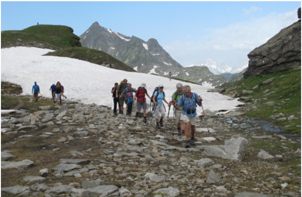
Bald werden hier die Alpenblumen spriessen: Aufstieg zur Scatta Minoia mit Restschnee

Der Abstieg verlief über Schneefelder an Steilhängen entlang dem Stausee Lago Vannino bis