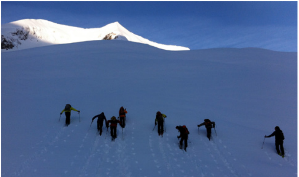
Impression Lawinenkurs 2012 Nr. 2.

Auskünfte und Voranmeldung: Raeto Steiger, 061 641 52 94, raeto.steiger@gmail.com