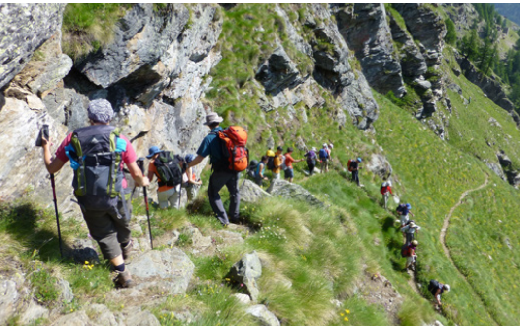
Abstieg von der Weisshornhütte.