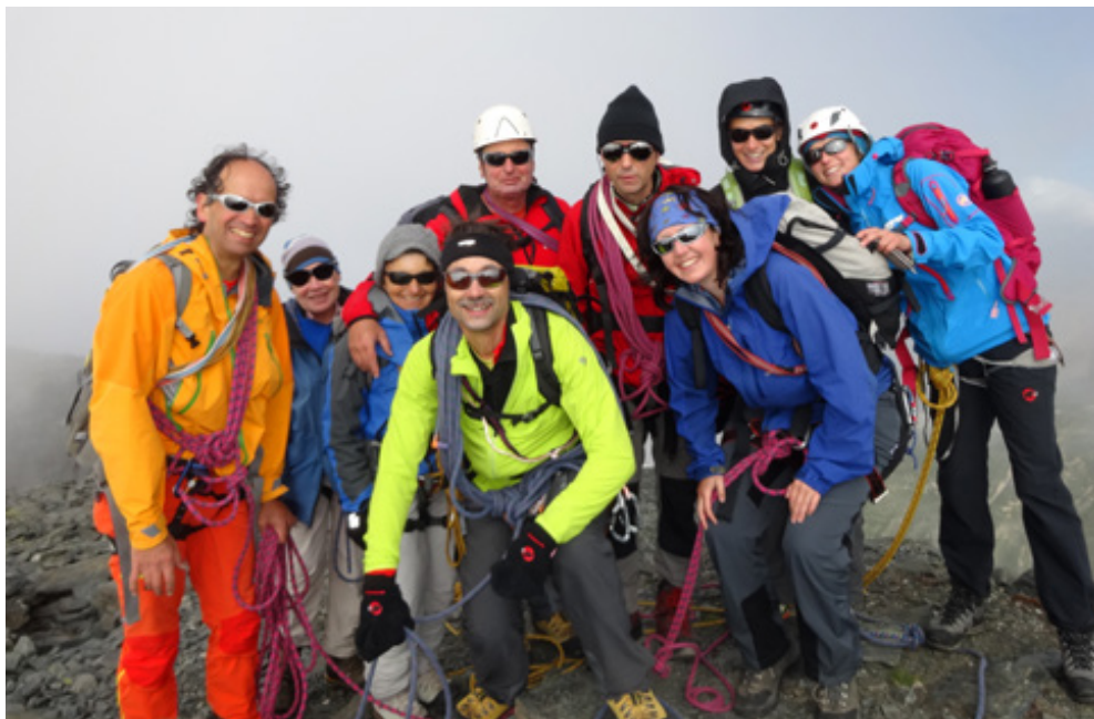
Stimmung top – Aussicht flopp. Bunte SAC-Truppe auf dem Bortelhorn.

Der Tag fing sehr gemütlich an, denn wir mussten erst um 7 Uhr auf den Zug! Bevor wir an unsere Grenzen kamen, kam schon die SBB an ihre Grenzen. Im Adlertunnel, kurz vor Liestal, blieb der Zug plötzlich stehen. Ein Bremsproblem. Wir rochen zwar nichts, waren einfach froh, dass wir mindestens Licht im Zug hatten und allzu heiss war es auch nicht, falls die Klimaanlage ausfallen würde. Immer wieder kamen Informationen durch ... Bremsproblem, aber noch nicht lokalisiert, wir sollten unbedingt im Zug sitzen bleiben. Schlussendlich wäre es zwar schneller gewesen, wenn wir alle ausgestiegen wären und zurück nach Basel gelaufen wären denn um 8.10 Uhr kam dann eine Rangierlok aus Basel und hat uns rückwärts nach Basel abgeschleppt. Wir wagten dann den 2. Versuch Richtung Wallis und nahmen den 8.30 Zug ab Basel, wissend, dass wir den Samstagsgipfel vergessen konnten.