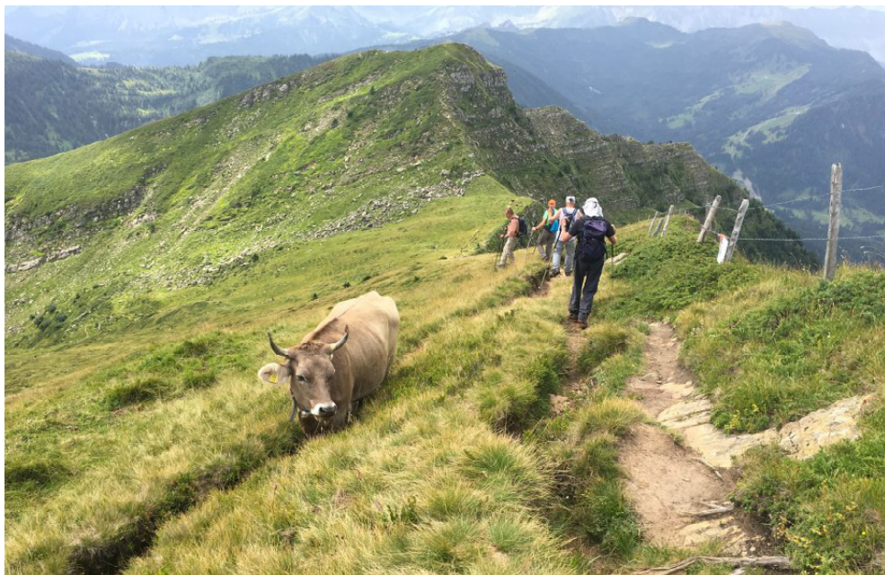
Veteranen-Wanderung auf den Fürstein

Jean-Pierre Michot, TelP 061 361 93 02, TelG 079 951 33 08, Mobile 079 951 33 08