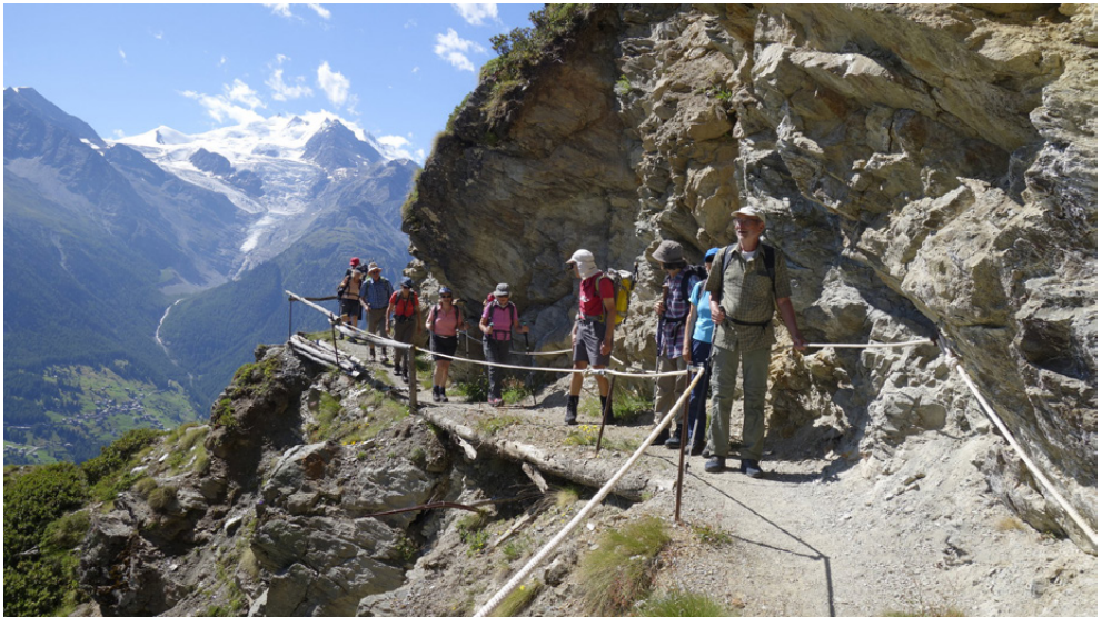
Werktags-Wanderung auf dem Höhenweg zur Moosalp

Anford./Zusatz Kond. A, Techn. T1 Route/Details Billets Basel SBB - Buuseregg hin Wanderung nach ???, Mittagessen im Restaurant Heimreise je nachdem von ??? oder ???, alles im TNW-Bereich Treffpunkt Mi 27. Dez. 2017, 9.15 Uhr / Passerelle Gleis 17 Anmeldung Telefonisch, Schriftlich, Internet bis Mo 25. Dez. 2017 Leitung Maria Riggenbach, TelP 061 301 82 42, Mobile 079 534 77 29