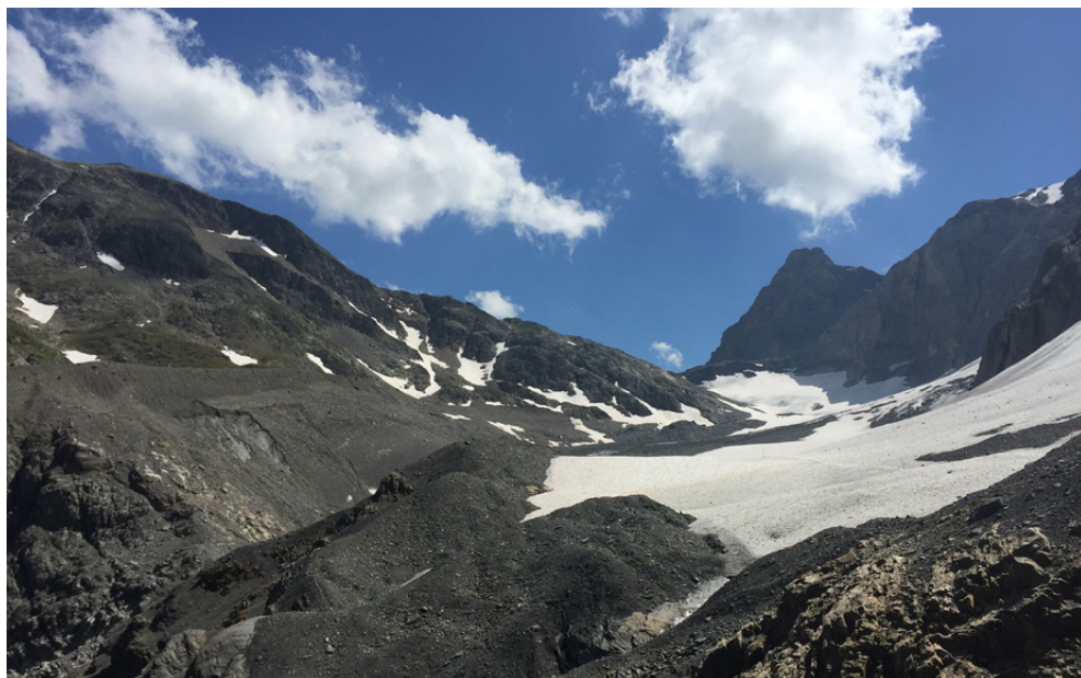
Blick vom Gasteretal am Standort «Balme» Richtung Süden über die Reste des Lötchengletschers. Im Hintergrund der Lötchenpass und rechts das Ferdenrothorn, davor ein Ausläufer des Balmhorns.

joch. Beide Passübergänge befinden sich auf der heutigen Grenze zwischen den Kantonen Wallis und Bern und zwar leicht unterhalb der Passhöhe in windgeschützter Lage auf der Berner Seite.