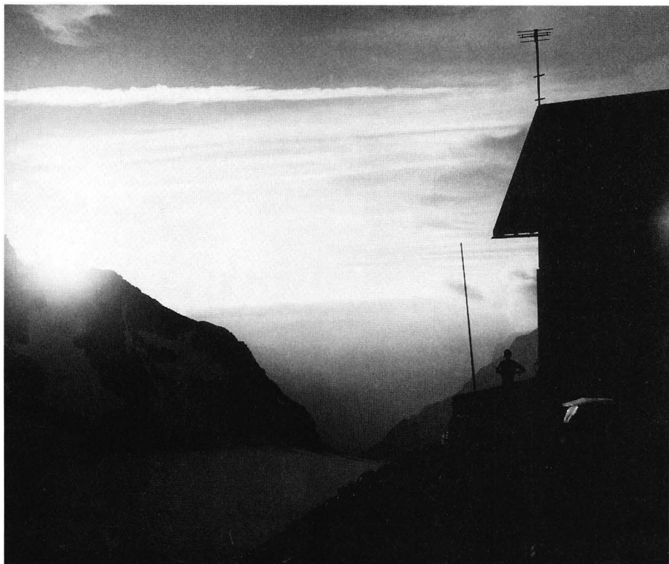
Strahlegghütte, Tempi passati