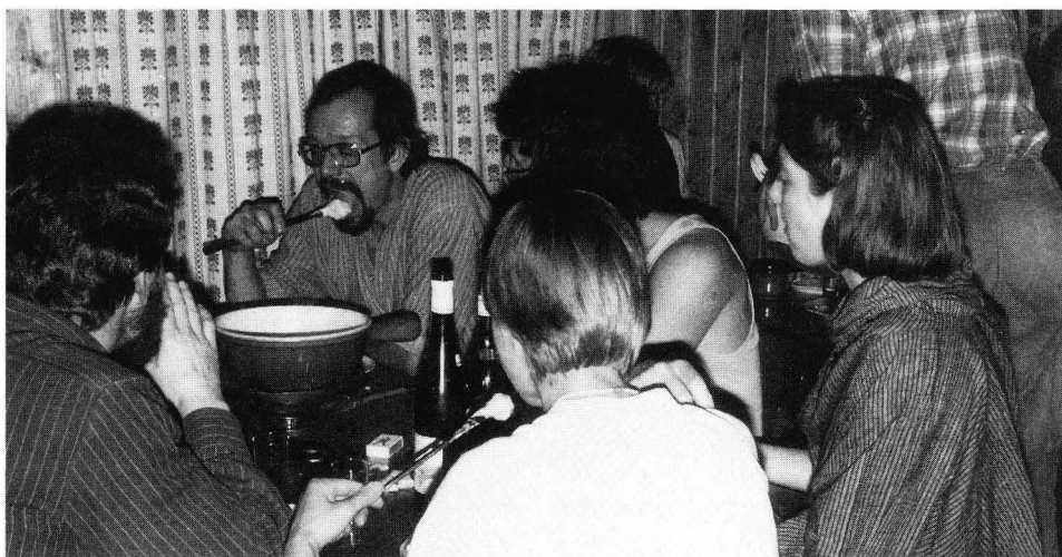
Die JO beim Fondue-Schmaus, 1984 Grathaus Moron

und seine Freunde werden alljährlich eine Reihe von Anlässen wie Feiern runder Geburtstage, Wanderungen mit naturkundlichen und kulturellen Zielen, und in grösseren zeitlichen Abständen kulturell-kulinarische Reisen in unsere Nachbarländer organisiert, wo bei Gelegenheit Besichtigungen von Kellereien in berühmten Weinbaugebieten den «wirtschaftlichen» Horizont der Teilnehmer erweitern.