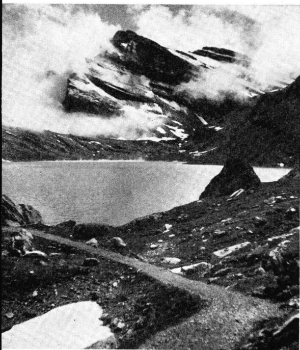
Daubensee mit Daubenhorn