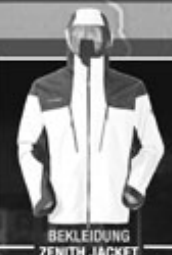
BEKLEIDUNG ZENITH JACKET