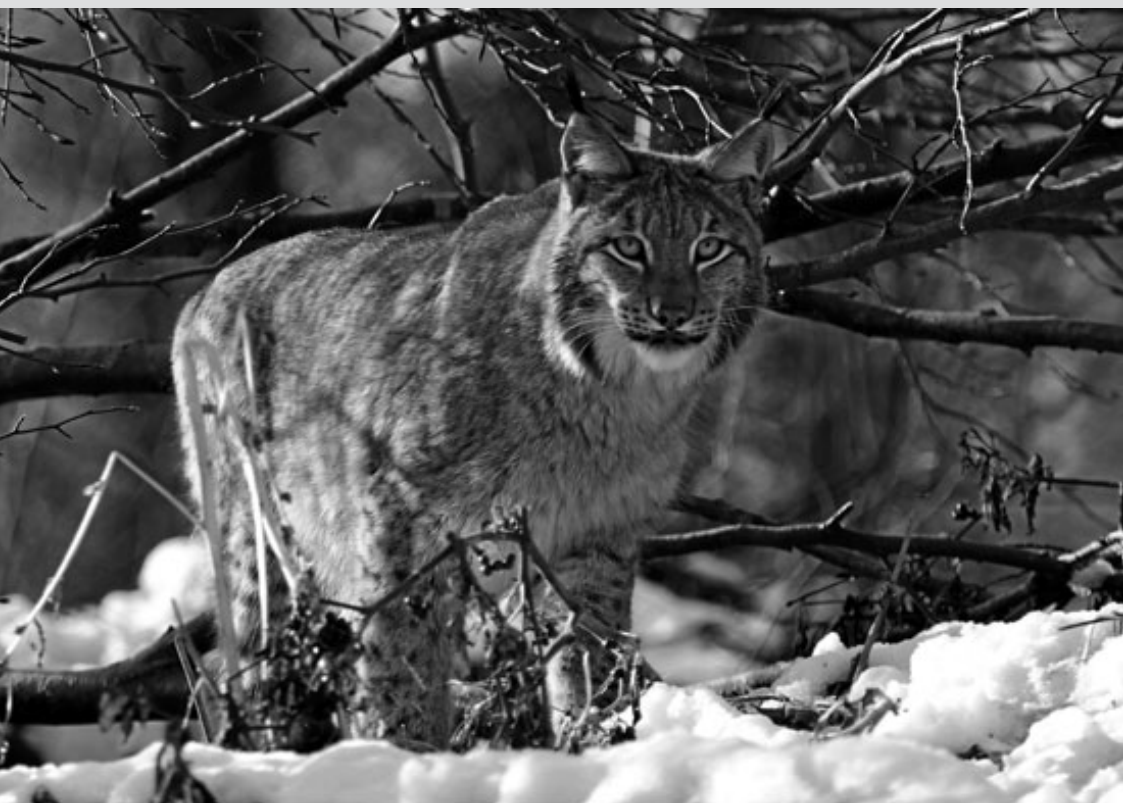
Der Luchs in seinem neuen Gehege im Tierpark Langen Erlen

Ausgabe Mai/Juni 2009 MB Nr. 3 41. Jahrgang | ZtgNr. 30240