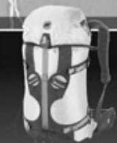
RÜCKSÄCKE FLIGHT 35