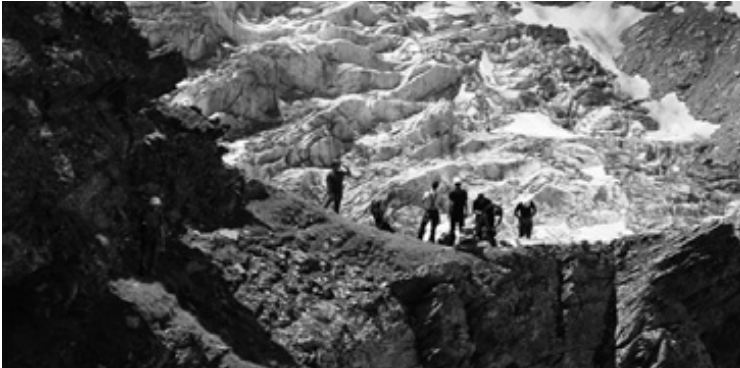
Das Grasband, das den Aufstieg ermöglicht (vgl. Text S. 11)